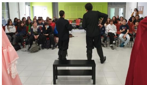
Moments d'échange après le spectacle

« En plus de leur don d'acteur, les artistes ont ici un rôle de « passeur ». Au-delà de leur passion, ils transmettent, une véritable leçon de vie ! »