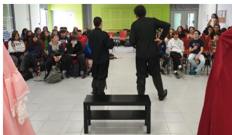
Moments d'échange après le spectacle