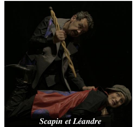
Scapin et Léandre