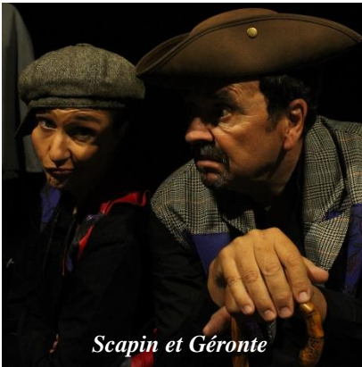
Scapin et GÉronte

En partenariat avec les équipes pédagogiques des collèges, nous proposons une démarche d'éducation artistique et culturelle et de sensibilisation des plus jeunes , en leur faisant découvrir de manière innovante une œuvre classique du répertoire, dans le cadre des instructions des programmes scolaires allant de la 6 ème à la 3 ème , avec un spectacle vivant ludique et pédagogique .